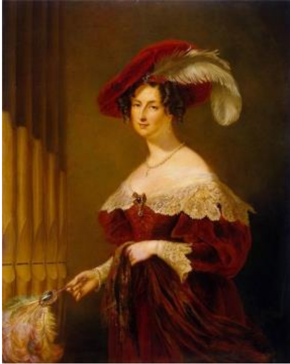
Джордж Хейтер. Воронцова Елизавета Ксаверьевна.

Перстень был парным, поэтому у Елизаветы остался двойник перстня, подаренного Пушкину. Каждый из перстей представлял собой массивное витое золотое кольцо со вставленным восьмиугольным полированным сердоликом багряного цвета, на котором была выгравирована таинственная надпись. Над надписью помещены стилизованные изображения виноградных гроздей — орнаментом, свидетельствующим об крымско-караимском происхождении драгоценности.