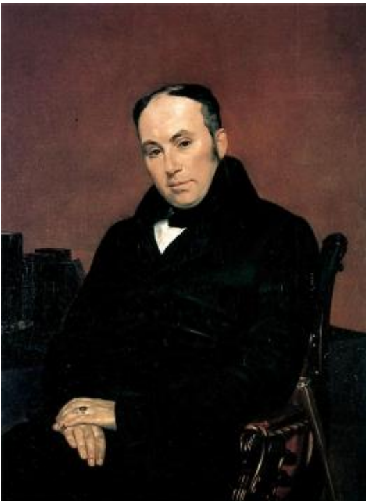
К. Брюллов. Портрет В. А. Жуковского 1837

Последующая история талисмана не менее интересна. После дуэли смертельно раненный поэт завещал свой перстень Василию Жуковскому. Последний также пользовался им, как печатью. И, аналогично Пушкину, не подозревал о значении содержавшейся на нем надписи. В письме С.М. Саковину, отправленном 20 июля 1837 года, Жуковский писал: «Печать моя есть так называемый талисман, подпись арабская, что значит, не знаю. Это Пушкина перстень, им воспетый и снятый с мертвой руки его».